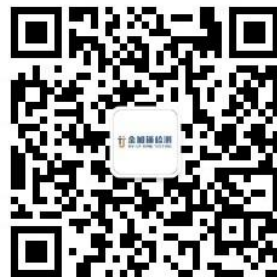
扫二维码查询报告真伪